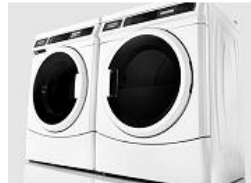
ACOPLAMIENTO DE LAVADORAS DISPONIBLE