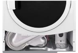
ACCESO PANEL FRONTAL