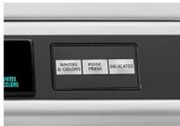
SELECCIÓN DE CICLO CON UN SOLO TOQUE